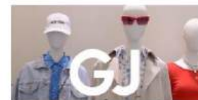
Рекламная кампания года. Бренд Gloria Jeans Открытие крупнейшего в России монобрендового флагманского магазина Gloria Jeans на Тверской