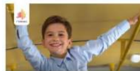
Эмоциональная связь с потребителем Сити-парк Град Воронеж Back2School