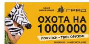
Максимальный охват Сити-парк Град Воронеж Охота на миллион