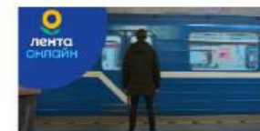
Победитель в сфере инноваций и технологий Лента. Виртуальный гипермаркет «Лента Онлайн»