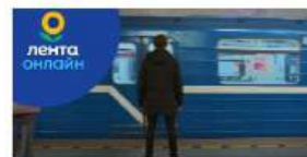
Креативная кампания года Лента Виртуальный гипермаркет «Лента Онлайн»