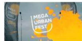
Рекламная кампания года. Торговый центр МЕГА Екатеринбург Фестиваль уличной культуры MEGA Urban Fest